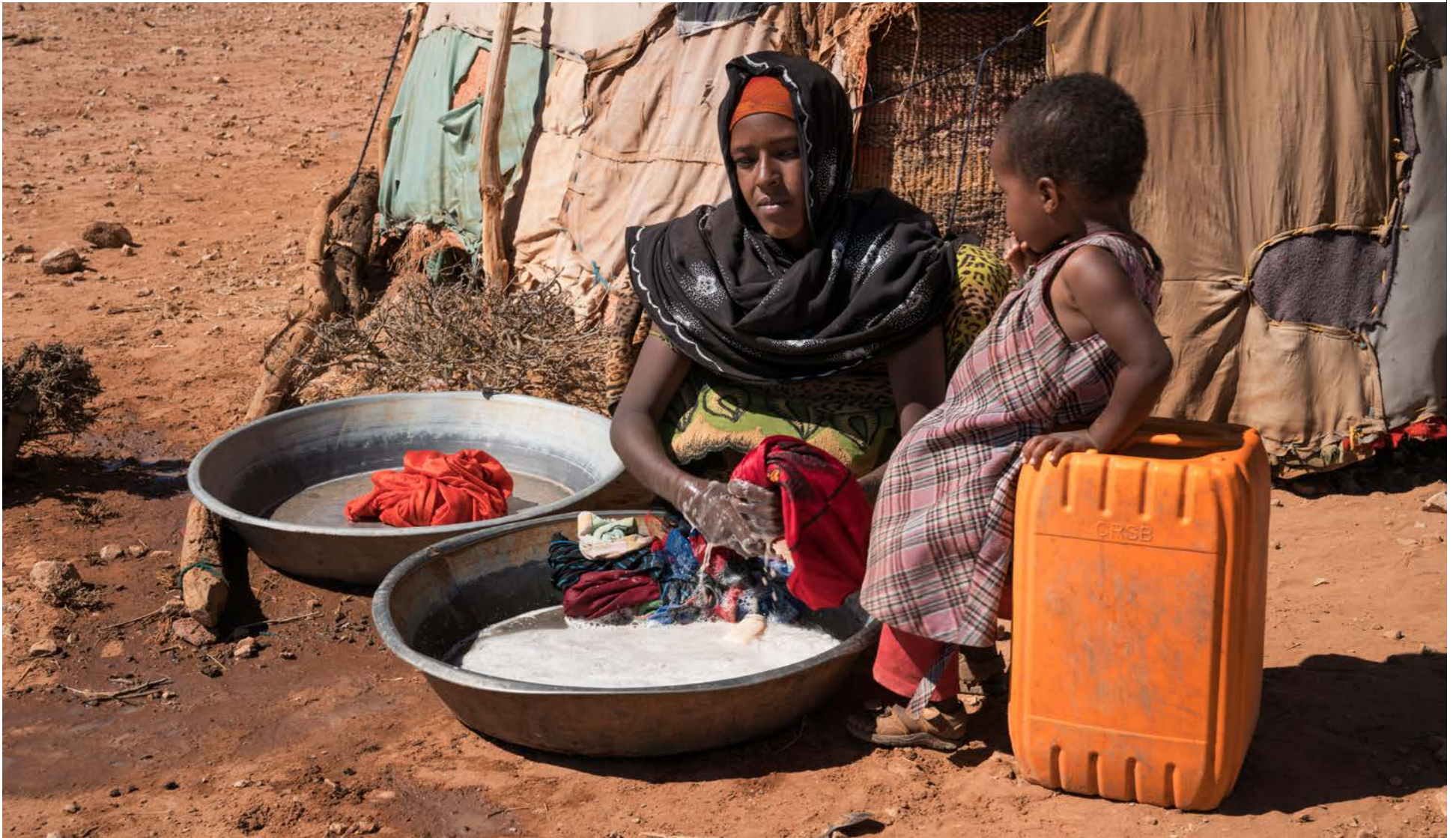
Konur í Sómalífylki hafa búið við ójafnrétti sem hefur haft neikvæð áhrif á heilsu og afkomu allra í samfélaginu.