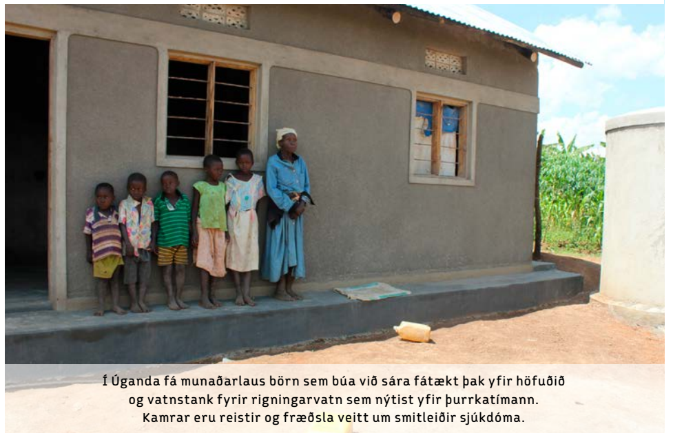
Í Úganda fá munaðarlaus börn sem búa við sára fátækt þak yfir höfuðið og vatnstank fyrir rigningarvatn sem nýtist yfir þurrkatímann. Kamrar eru reistir og fræðsla veitt um smitleiðir sjúkdóma.