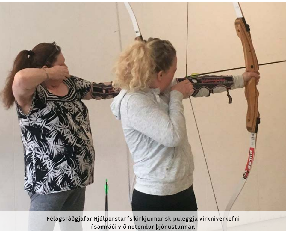
Félagsráðgjafar Hjálparstarfs kirkjunnar skipuleggja virkniverkefni í samráði við notendur þjónustunnar.