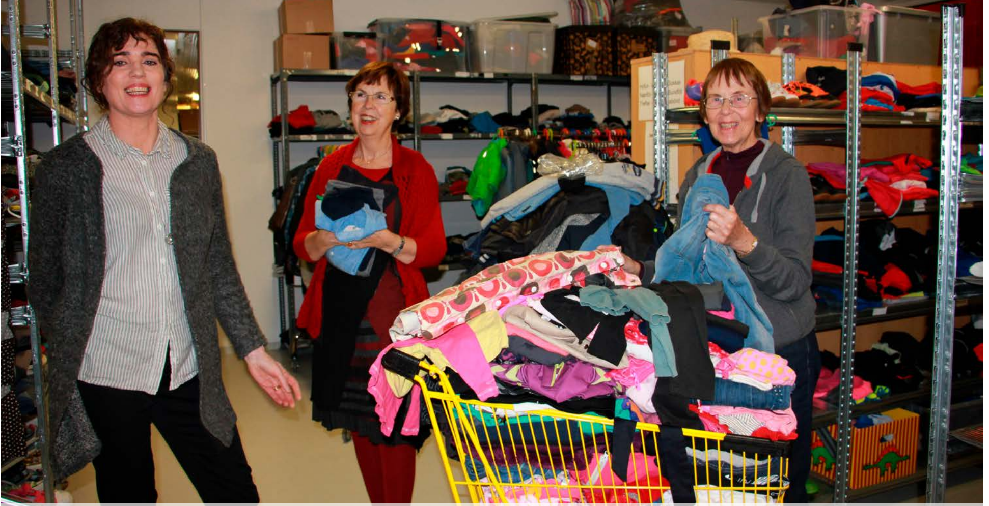
Sjálfbóðaliðar Hjálparstarfs kirkjunnar taka á móti fatnaði sem berst, flokka hann og raða í hillur eftir stærð og kyni ásamt því að taka á móti fólki sem leitar eftir fatnaði á þriðjudögum klukkan 10-12.