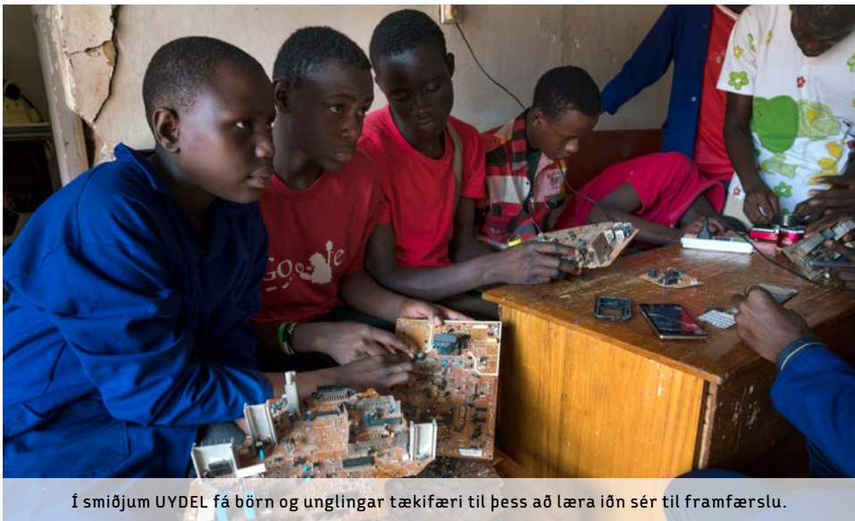
Í smiðjum UYDEL fá börn og unglíngar tækifæri til þess að læra iðn sér til framfærslu.