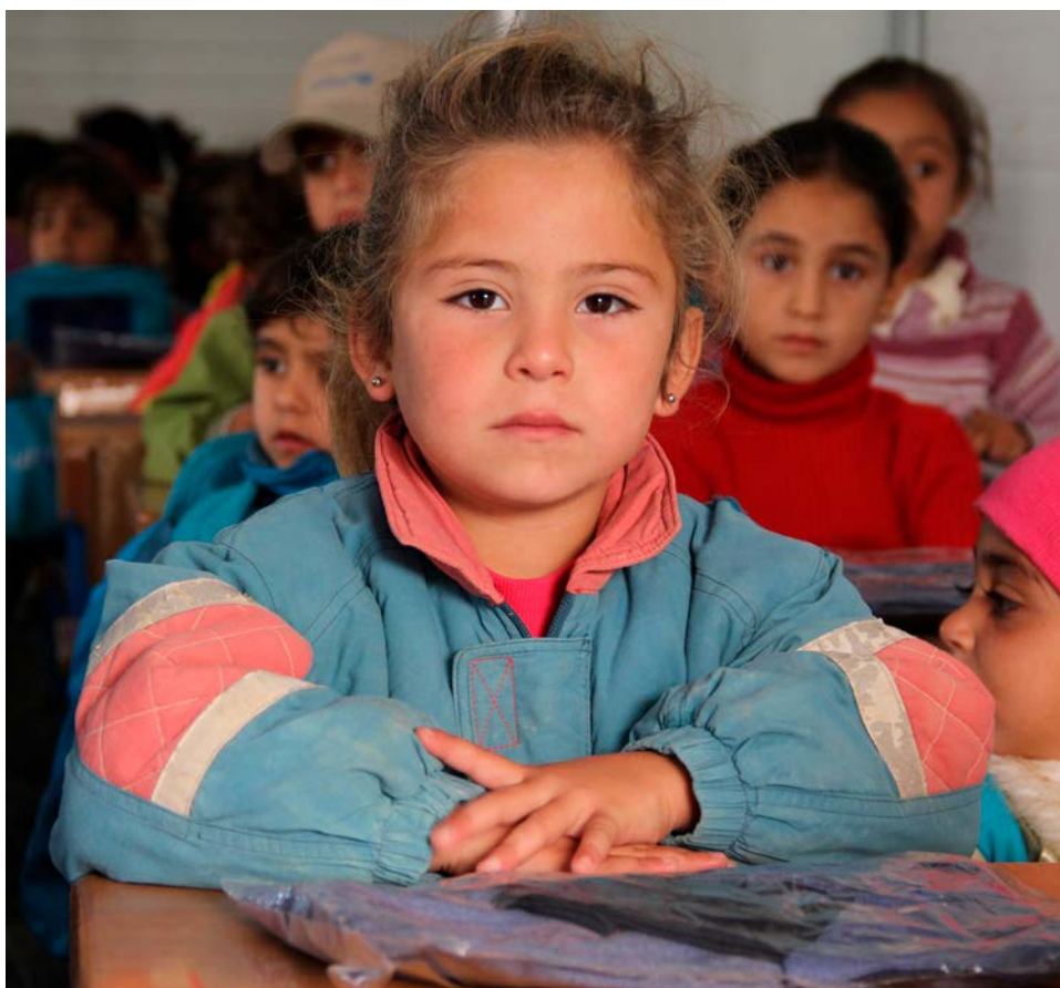
Í Jórdaníu fær flóttafólk frá Sýrlandi aðstoð vegna átaka.