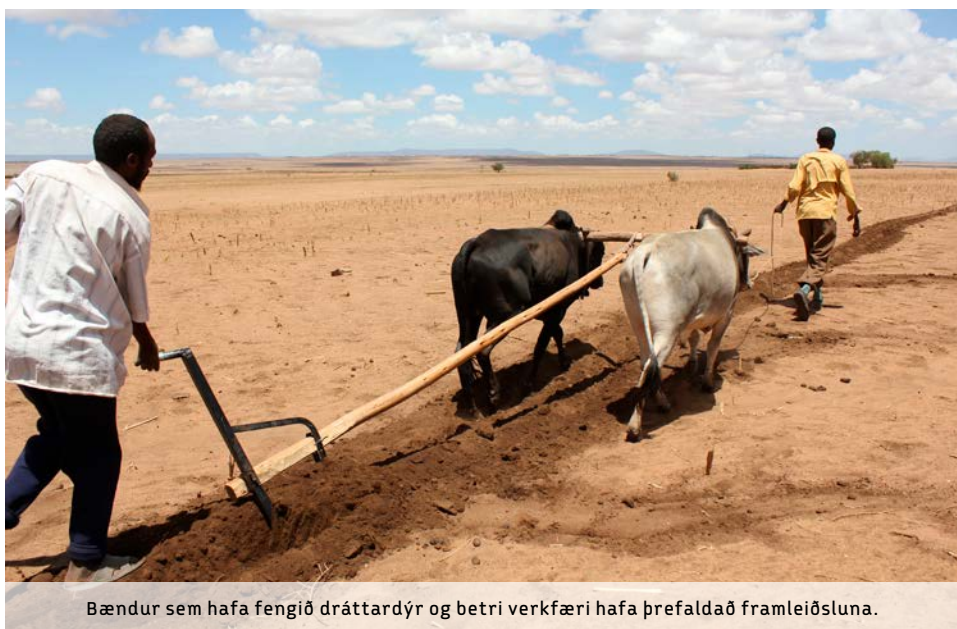
Bændur sem hafa fengið dráttardýr og betri verkfæri hafa þrefaldað framleiðsluna.