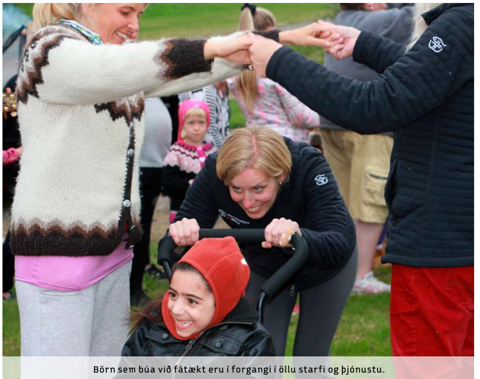
Börn sem búa við fátækt eru í forgangi í öllu starfi og þjónustu.