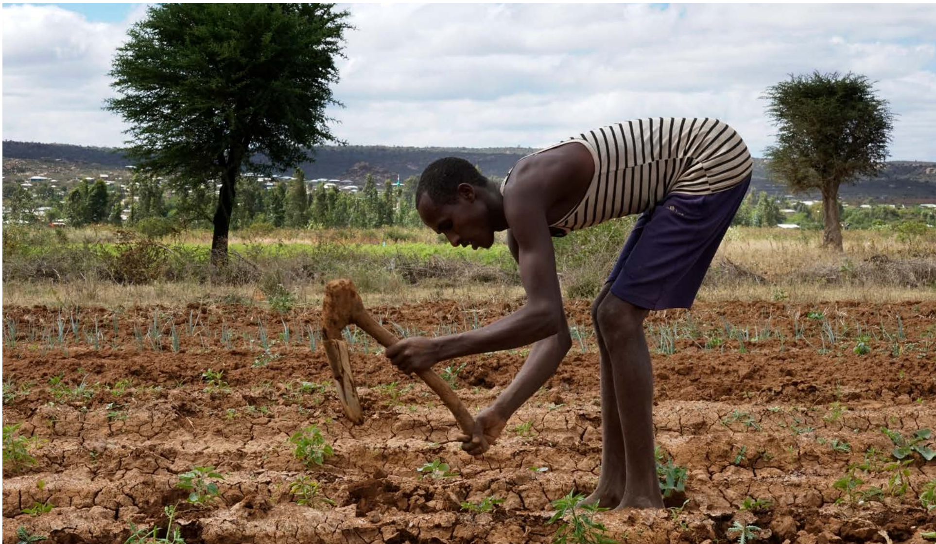
Í Sómalífylki í Eþíópíu eiga bændur ekki almennileg verkfæri. Það tekur því langan tíma að plægja akurinn og fæðuöryggi íbúanna hefur því verið takmarkað.