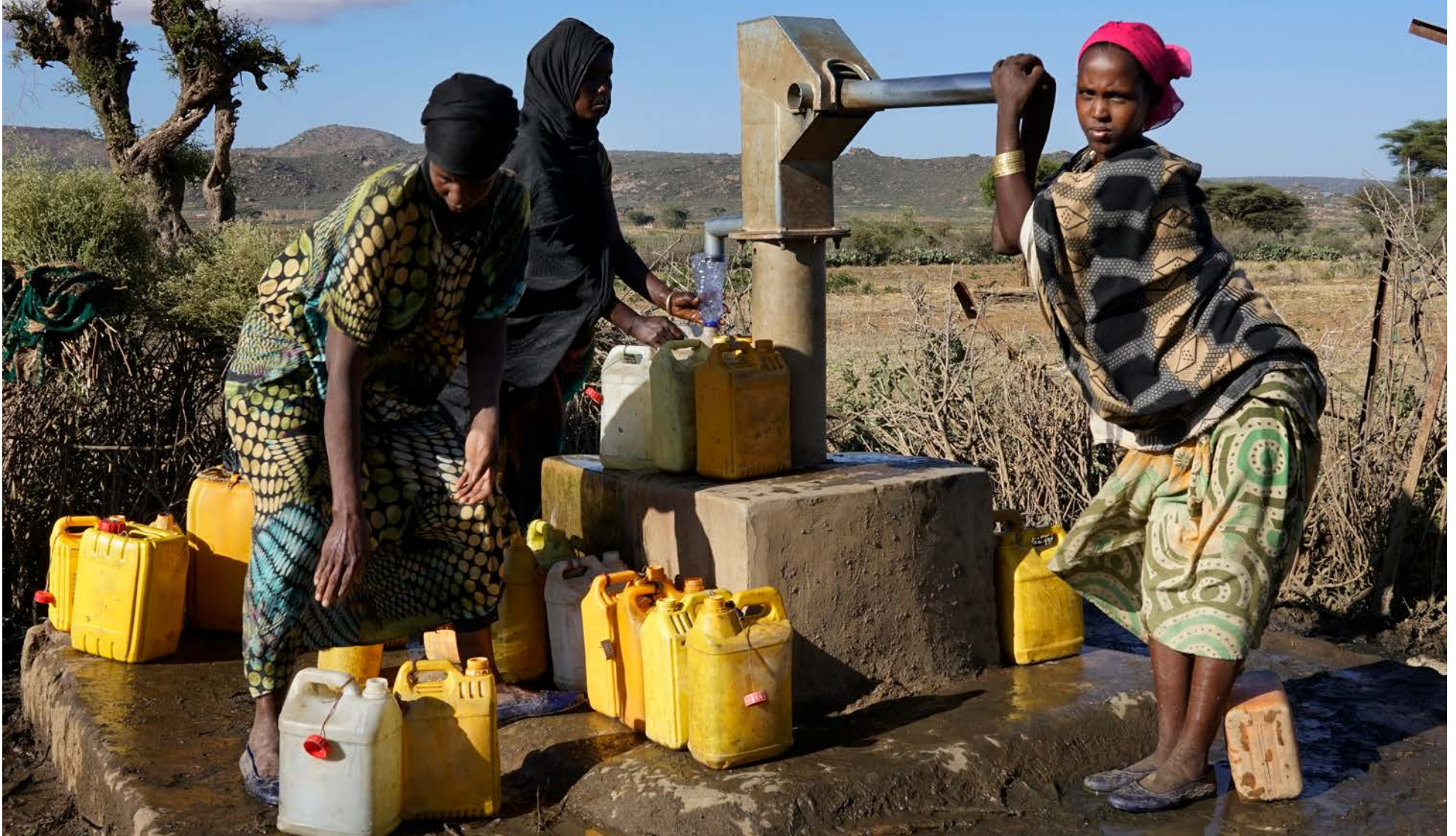
Aðgengi að drykkjarhæfu vatni við þorpskjarnann gjörbreytir lífsskilyrðum fólksins sem við vinnum með í Eþíópíu. Almenn heilsufar batnar og stúlkur hafa tíma til að sækja skóla.