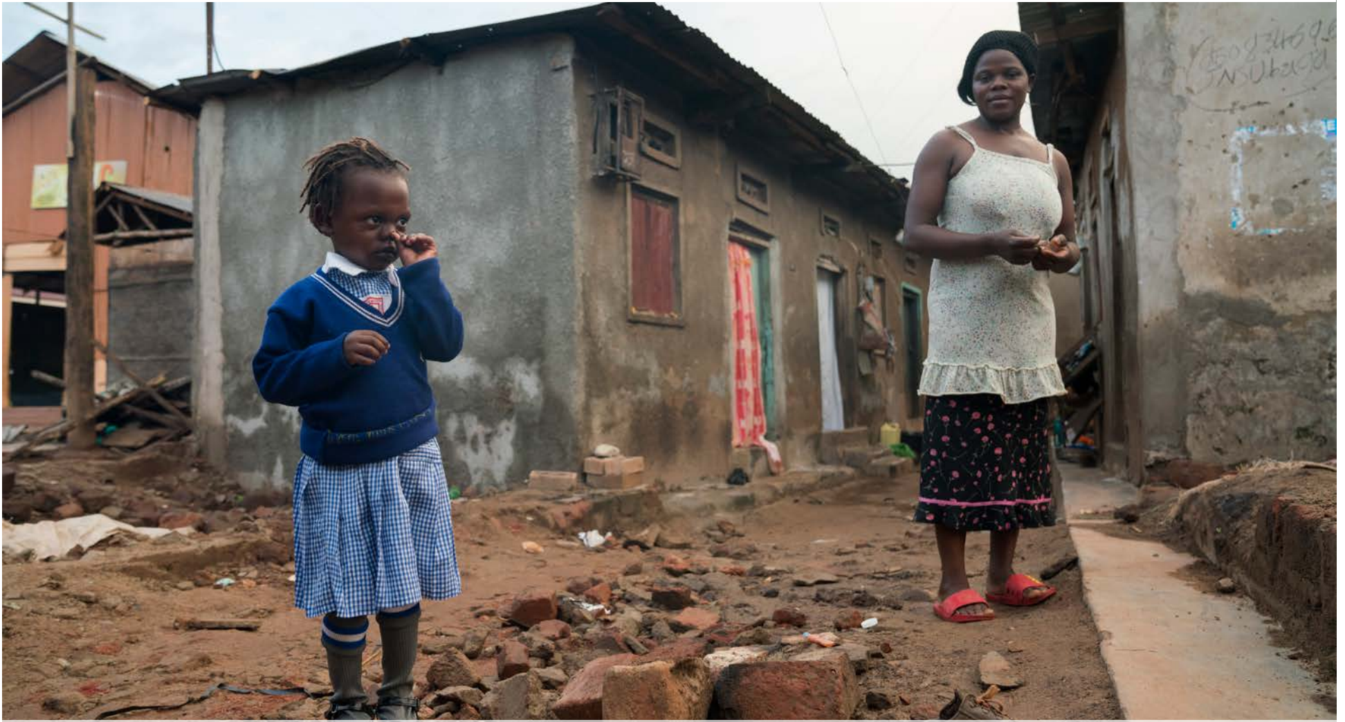
Nístandi fátæktin í fátækrahverfum Kampala neyðir unglíngana út á ógæfubraut. Börnin eru útsett fyrir misnotkun og verða auðveldlega fíkniefnum að bráð.