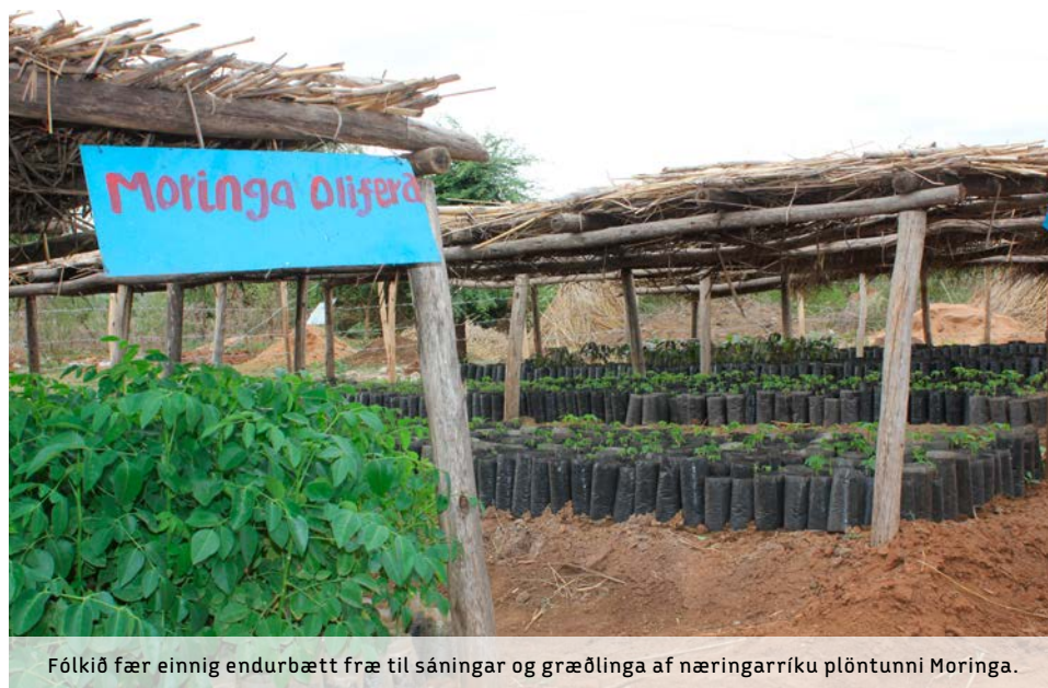
Fólkið fær einnig endurbætt fræ til sáningar og græðlinga af næringarríku plöntunni Moringa.