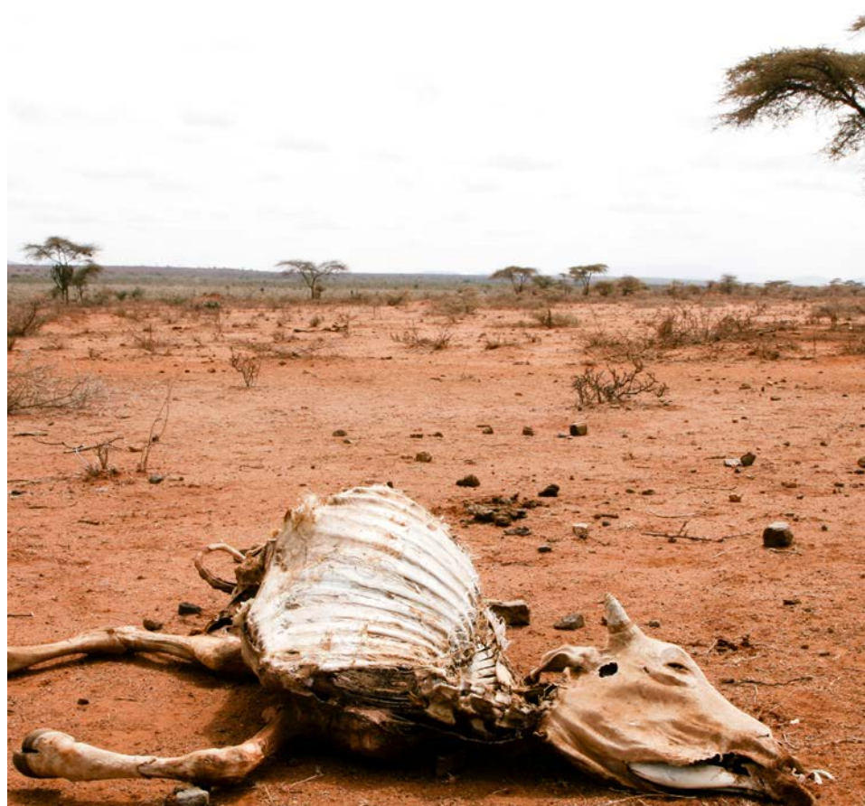
Í Órómía- og Sómalífylkjum Eþíópíu fær fólk aðstoð vegna þurrka, flóða og átaka.