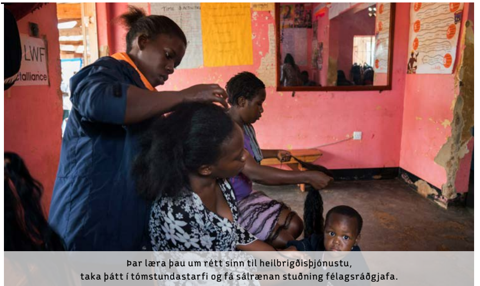
Þar læra þau um rétt sinn til heilbrigðisþjónustu, taka þátt í tómstundastarfi og fá sálrænan stuðning félagsráðgjafa.