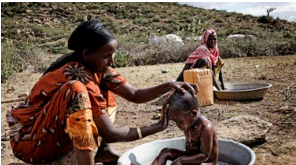
Konurnar bera ábyrgð á að fæða og klæða börnin, þvo þeim og koma í skólann.