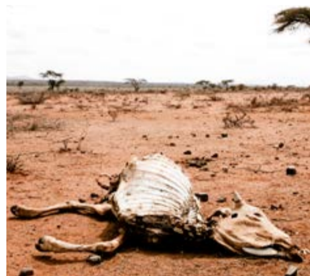
Þurrkar í Eþíópíu eru meðal annars raktir til loftslagsbreytinga.

Á kirkjuþingi í nóvember 2017 var kirkjuráði og umhverfisnefnd kirkjunnar falið að fylgja umhverfisstefnunni eftir með aðgerða- og starfsáætlun til að að vekja starfsólk og söfnuðinn til umhugsunar um náttúruna og náttúruvernd, veita þeim úrræði til að sporna gegn frekari loftslagsbreytingum og til að leggja sitt að mörkum.