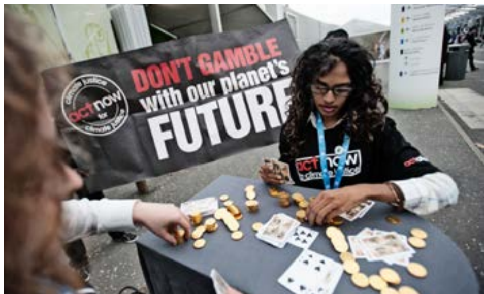
Ungur aðgerðarsinni ACT Alliance hvetur ríki heims til að spila ekki með framtíð jarðar.

Hjálparstarf kirkjunnar er aðili að Alþjóðahjálparstarfi kirkna, ACT Alliance, sem ásamt því að vinna að þróunarsamvinnu veitir neyðaraðstoð í kjölfar náttúruhamfara og vegna vopnaðra átaka. Aðstoðin er veitt án skilyrða og aðgreiningar og fer fram eftir alþjóðlegum stöðlum um neyðaraðstoð og ströngum siðareglum.