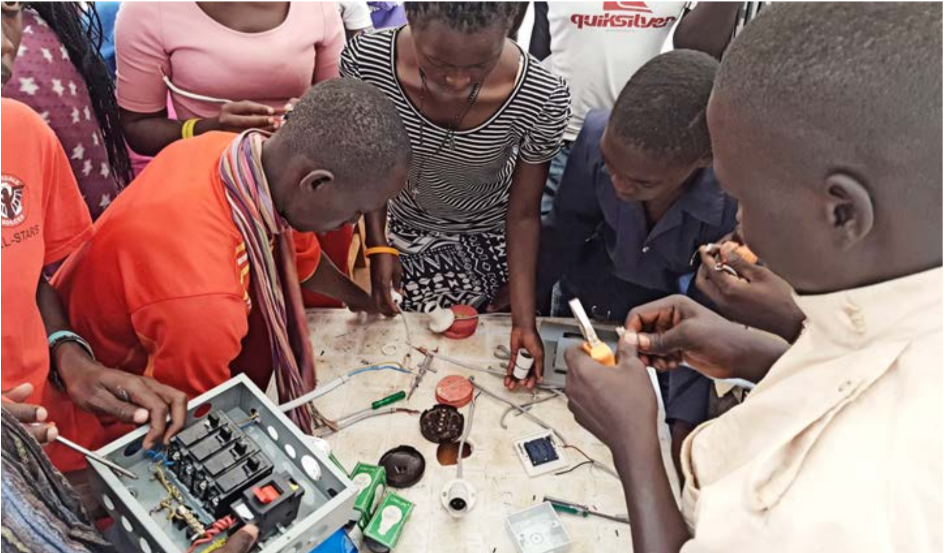
Í verkmenntamiðstöðvunum velja ungmennin sér svið og öðlast hæfni til að verða gjaldgeng á vinnumarkaði svo sem við hárgreiðslu, matreiðslu, saumaskap og rafvirkjun.