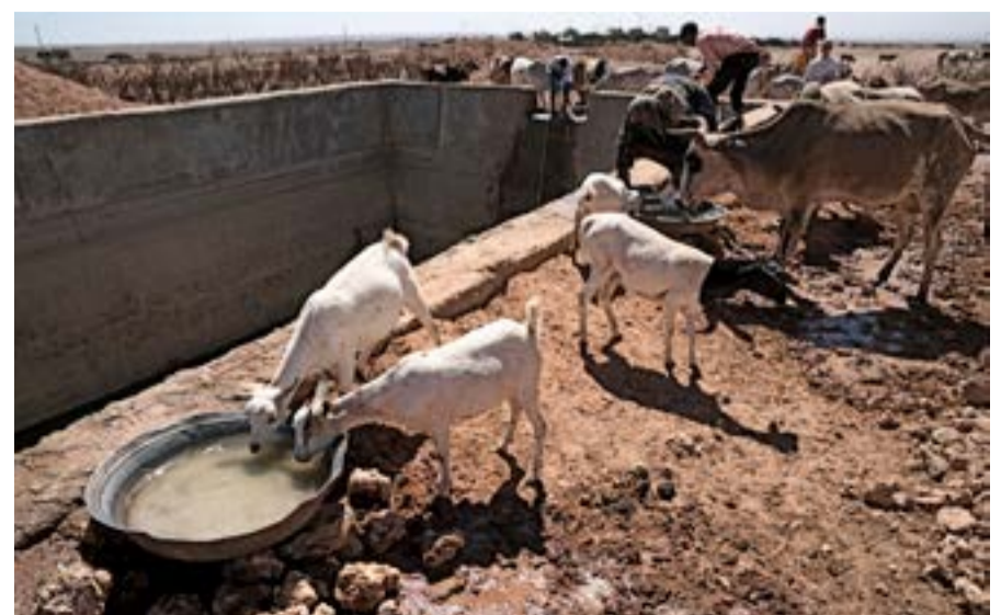
Þegar regnvatn er komið í birkurnar við þorpin geta dýrahirðar brynnt dýrunum án þess að fara lengra en einn kílómetra í burtu heiman frá.