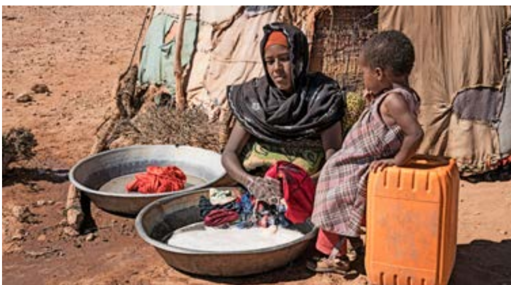
Konurnar sjá um að þrifa og þvotta.