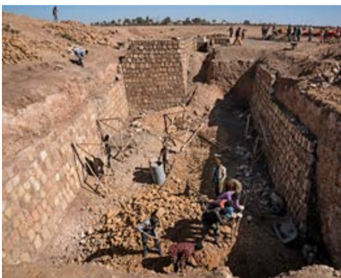
Þar sem djúpt er á grunnvatn og því mjög kostnaðarsamt að grafa eftir brunni eru vatnsþrær sem heimamenn kalla birkur grafnar. Birkurnar eru múrsteinshlaðnar og múraðar tröppur ná niður á botn þeirra. Í birkurnar safnast rigningargvatn yfir regntímann. Vatnið í þeim dugur oft langt inn í þurrkatímann en blanda þarf vatnshreinsidufti í vatnið úr birkunum áður en fólk drekkur það.

Stór þáttur í verkefnum Hjálparstarfs kirkjunnar í Sómalí fylki snýr að því að aðstoða bændur við að