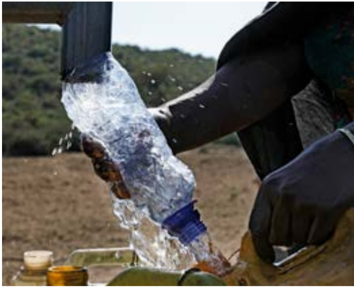
Þar sem brunnar og vatnsþrær tryggja aðgengi að vatni þurfa konur og stúlkur nú aðeins að nota um 15 mínútur til að fara eftir vatni í stað þriggja klukkustunda áður.