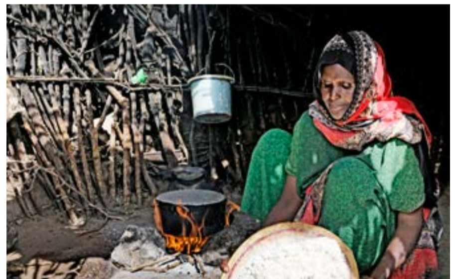
Konurnar nota eldivið við matreiðslu. Þegar hann brennur fyllir reykurinn loftið inni í hústjöldunum og því eru öndunarsjúkdómar algengir í fylkinu.