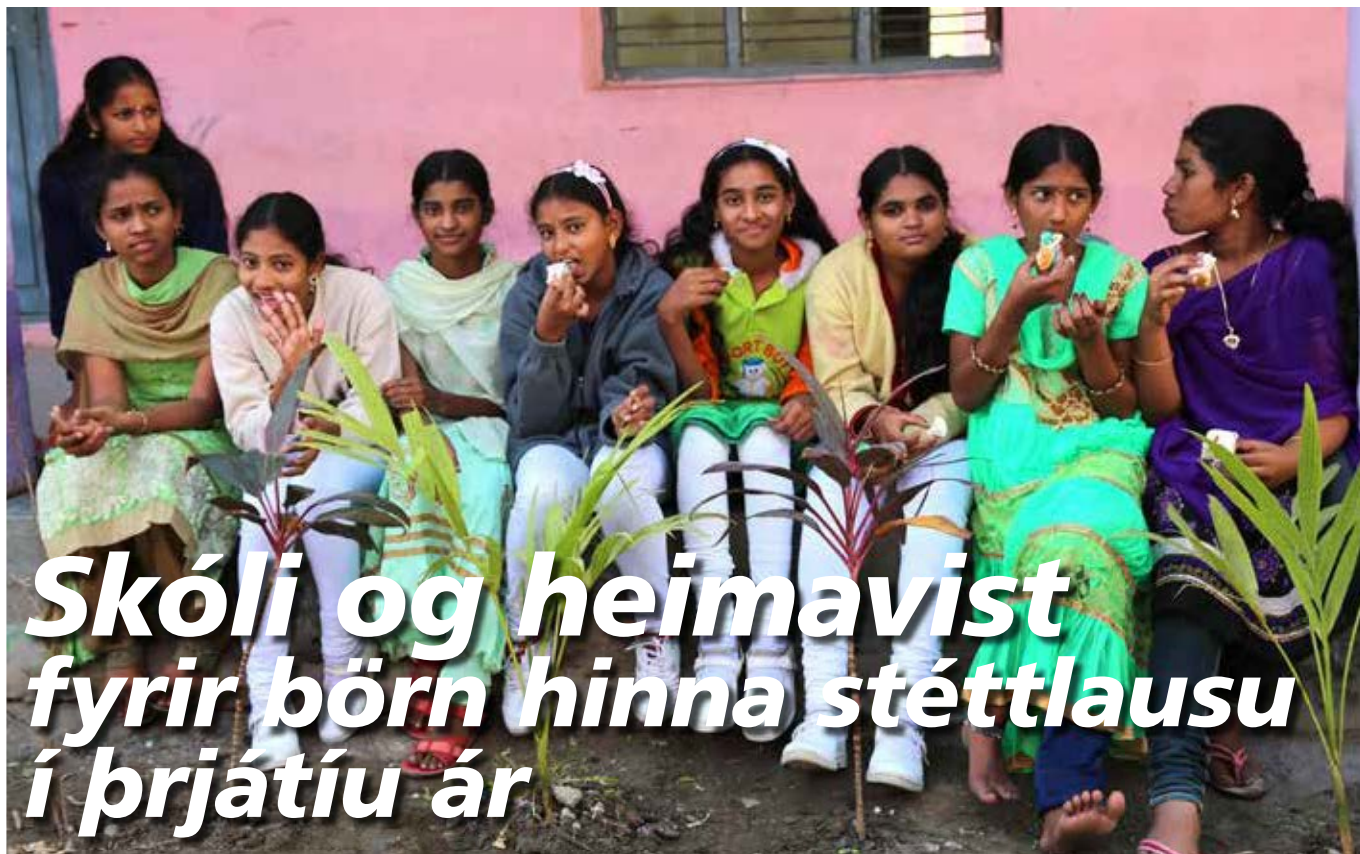
Unglingar fá tækifæri til verknáms hjá UCCI. Meðal námsgreina eru körfugerð saumar, smíði, rafiðn og jarðrækt.

Frá árinu 1989 hafa Hjálparstarf kirkjunnar og Fósturforeldrar stutt starf Sameinuðu indversku kirkjunnar, United Christian Church of India eða UCCI, með því að greiða kostnað við skóla- og heimavist fyrir börn og unglunga ásamt því að senda stök framlög til viðhalds bygginga og til starfsemi 40 rúma sjúkrahúss sem UCCI rekur. Starfsárið 2018 – 2019 styrktu Hjálparstarf kirkjunnar og Fósturforeldrar 225 börn og unglunga til náms en auk þess greiddi Hjálparstarfið laun fyrir átta kennara við skólann. Heildarframlag nam 10,7 milljónum króna.