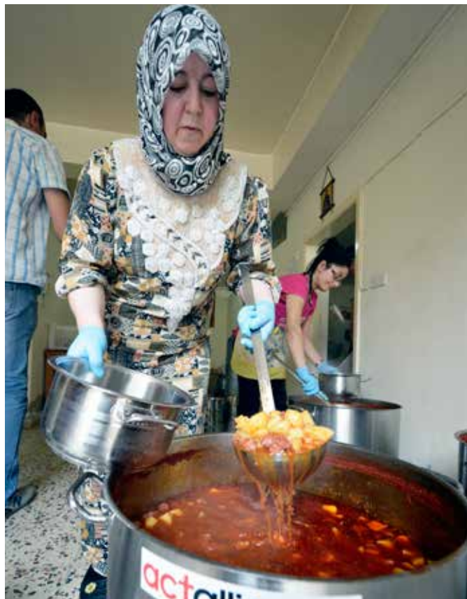
Í súpueldhúsi í Líbanon vinna sýrlenskar konur á flóttu með konum úr móttökusamfélaginu við að matbúa fyrir fólk sem hefst við í óformlegum flóttamannabúðum þar sem yfirvöld eru treg til að reisa formlegar búðir. Samvinnan hjálpar flóttakonunum að aðlagast nýju samfélagi og samfélaginu að aðlagast þeim.