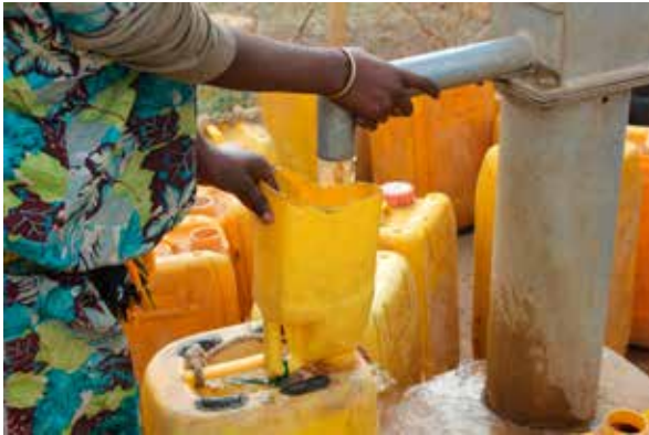
Þegar brunnur er kominn við þorpið er hægt að nota tímann til annars, til dæmis að fara í skóla.