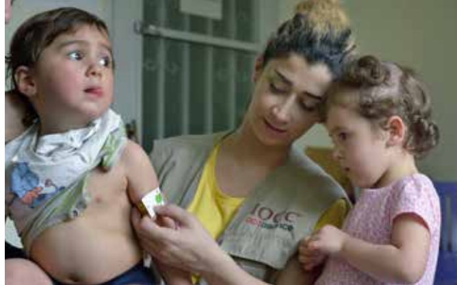
Heilbrigðisfulltrúi Alþjóðlegs hjálparstarfs kirkna í Líbanon kannar næringarástand litils drengs til að ákveða hvort hann þurfi auka næringu en flóttafólk fær þar heita máltíð einu sinni á dag og nýtur heilbrigðisþjónustu.

Í upphafi árs 2016 sendi Hjálparstarfið 22,5 milljónir króna til neyðaraðstoðarinnar með veglegum styrk frá utanríkisráðuneytinu en árið 2014 var framlag upp á 16,6 milljónir króna sent til þessa brýna mannúðarstarfs og nemur því heildarframlag Íslendinga til mannúðaraðstoðar Alþjóðlegs hjálparstarfs kirkna á svæðinu 39,2 milljónum króna.