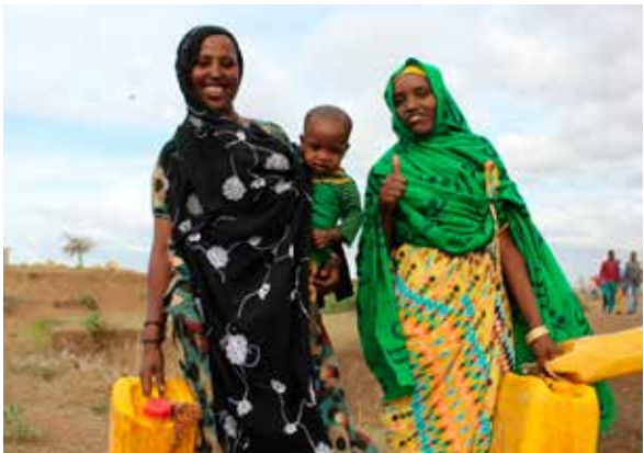
„Takk fyrir hjálpina,“ segja konur á verkefnasvæði Hjálparstarfs kirkjunnar í Jijiga í Eþíópíu.