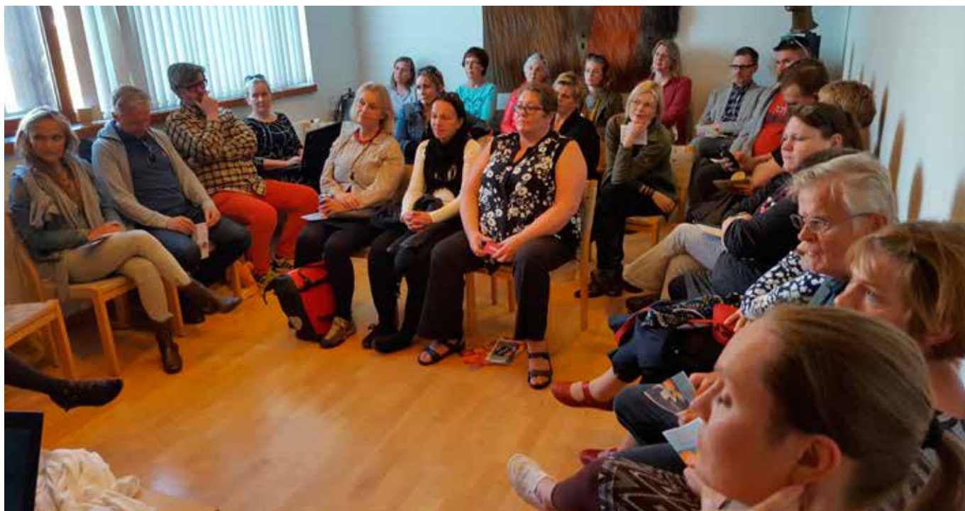
„Flokkest umræða um fátækt í fjölmiðlum undir fátæktarklám?“ var meðal þess sem rætt var á Fundi fólksins í Norræna húsinu í september síðastliðnum.

Fram kom að erfitt væri að ræða um fátækt með tölfraðilegum rökum einum þar sem þau væru lítt áhugavekjandi og að fólk fylgdist betur með þegar rætt væri um einstaklinga eða eins og sagt var: „Við skynjum betur fólk en tölfraedi, því eru sögur af fólki miklu áhrifameiri en tölfraedin.“