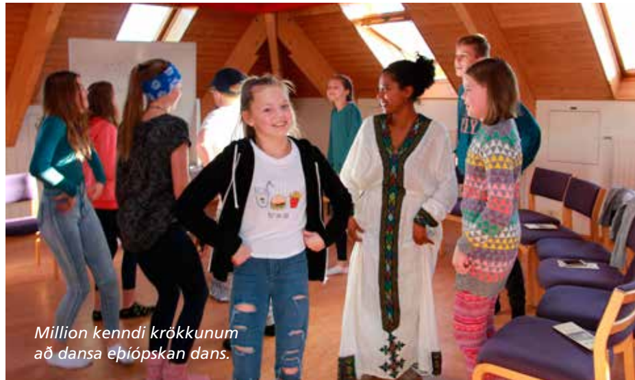
Million kenndi krökkunum að dansa eþíópiskan dans.

Stærsta verkefni Hjálparstarfs kirkjunnar í þróunarsamvinnu er í Sómalífylki í Austur-Eþíópíu en fylkið er eitt af þeim fjóru fátækustu í landinu. Meginmarkmið verkefnisins er að treysta fæðuöryggi og auka framfærslumöguleika fátækra bænda með því að bæta aðgengi að vatni, stuðla að betri ræktunaraðferðum og meiri framleiðni ásamt því að vinna að valdeflingu kvenna í samfélaginu.