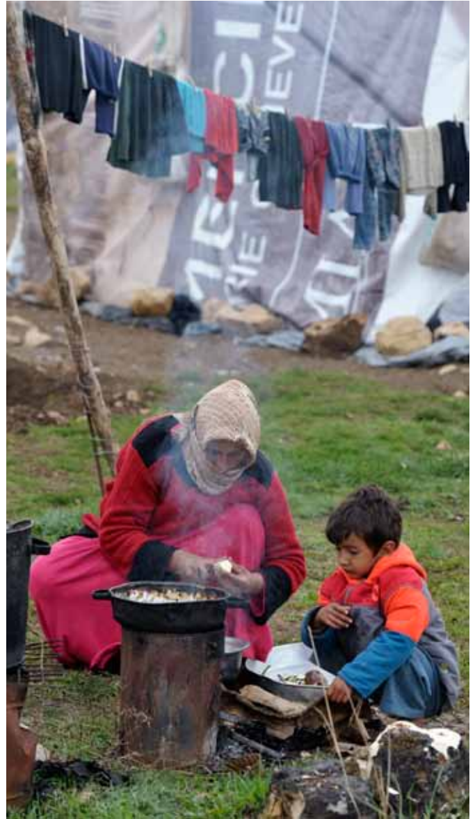
Móðir og sonur frá Sýrlandi hjálpast að við matargerð í tjaldbyggingu í fátækrarhverfi Jeb Jenine í Líbanon.

Með snörum viðbrögðum er enn hægt að afstýra verstu afleiðingum hnattrænnar hlýnunnar. Leiðtogar heims verða að ná samkomulagi þar um á loftslagsráðstefnu nú í desember en