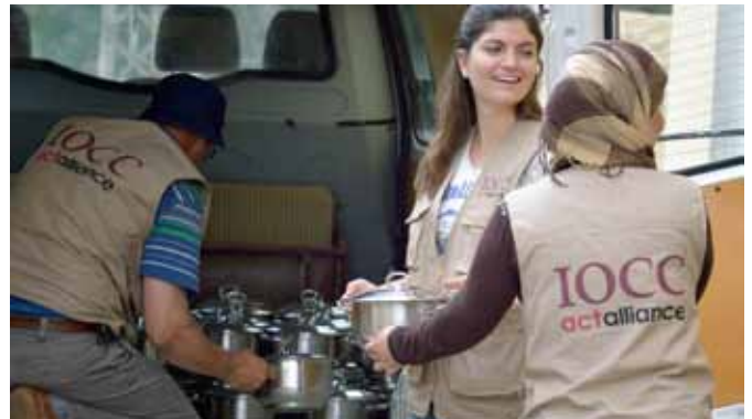
Starfsfólk IOCC keyra heita máltíðina frá eldhúsinu og til fólksins sem býr í tjaldbyggð flóttafólks í fátækrahverfi í þorpínu Minyara.