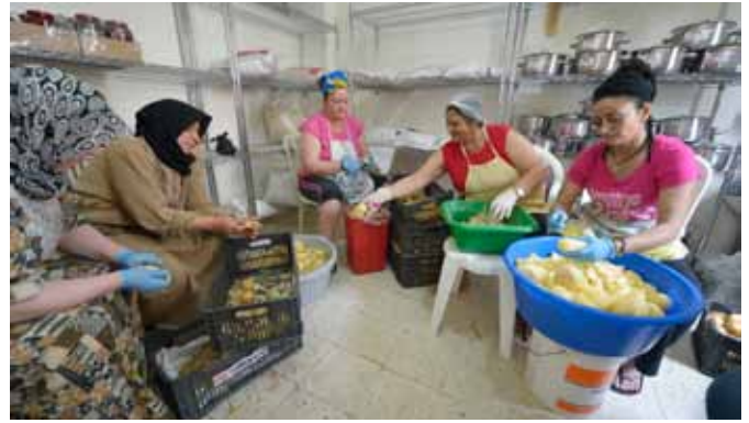
Flóttakonur frá Sýrlandi og konurnar úr þorpínu hjálpast að við að matreiða fyrir börn, barnshafandi konur, fatlaða og aðra sem ekki hafa eldunaraðstöðu. Máltíðin inniheldur 17% fitu og 12% prótein og næga orku fyrir daginn.

Í Líbanon er nú um 1,5 milljón flóttamanna frá Sýrlandi. Þrátt fyrir það hafa stjórnvöld í landinu ekki leyft hjálparsamtökum að reisa flóttamannabúðir. Flóttafólk hópast því saman í fátækrahverfum við landamærin. IOCC, systursamtök Hjálparstarfsins á vettvangi, veita fólki þar margvíslega aðstoð, meðal annars sjá þau fólkinu fyrir heitri og næringarríkri máltíð einu sinni á dag.