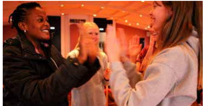
Trudy kennir krökkum í fermingarfræðslu á Íslandi ýmsa leiki að heiman en þeir eiga það sammerkt að þeir krefjast ekki leikfanga hvað þá snjallsíma.