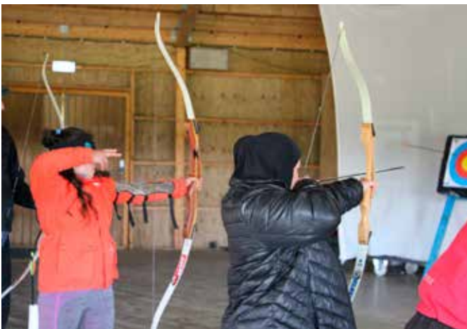
Æfingin skapar meistarann. Bogfimin var vinsæl meðal mæðranna í hópnum sem hittu í mark með einbeitinguna að vopni.