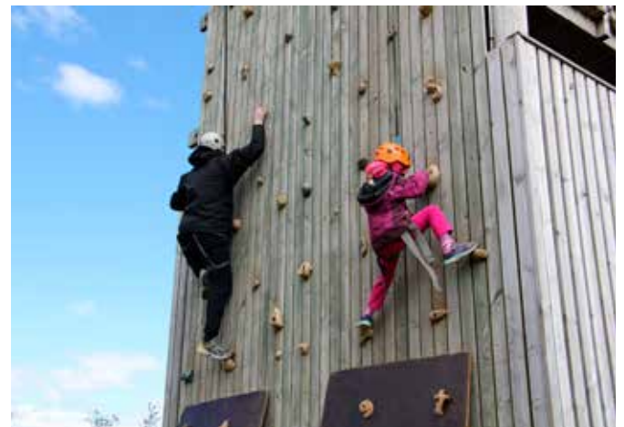
Klifurturnin við Úlfjótstvatn er frábær áskorun fyrir börn jafnt sem fullorðna enda nýtur hann mikilla vinsælda.

Önnur mamma sagði dvölinna hafa allt sem einkenndi gott frí; skemmtun, félagsskap og góðan mat. Hún var ánægð með hversu þétt dagskráin var en fólk var að sjálfsgöngu frjálst að taka þátt í henni að vild. „Ég slappaði vel af þótt ég væri alltaf að,“ sagði hún.