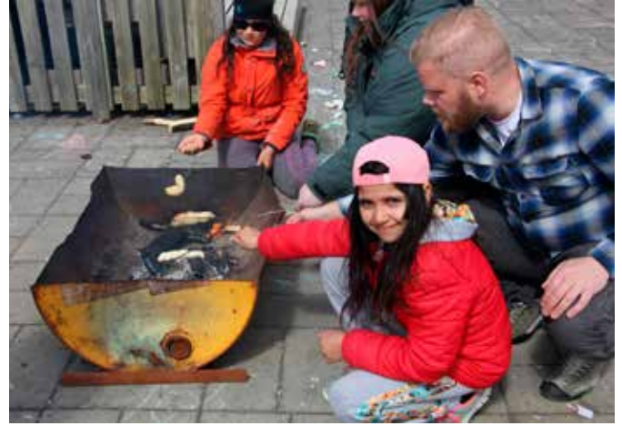
Að baka brauð frá grunni þótti spennandi en það krafðist þolinmæði. Fyrst var að höggva niður sprekk og búa til bálköst og svo að bíða þolinmóð eftir að deigið bakaðist á teininum yfir opnum eldi.