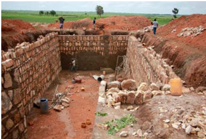
Hér sést hvar ný vatnspró eða birka er hlaðin í maí síðastliðnum. Hún verður tilbúin til notkunar á næsta regntíma, í júlí og ágúst.

Í þorpinu Gebobe hittum við fólk sem sagði okkur að nú þyrftu þorpsbúar ekki lengur að greiða einkaaðilum fyrir vatn en áður en vatnspróin eða birkan þar var gerð í fyrra þurfti fólk að greiða sem svarar 18 - 30 krónur fyrir 20 lítra af vatni. Áður tók það líka heilan dag að fara eftir vatninu með asna en nú er birkan sem safnar rigningavatni við þorpið. Í jiggga er blessunarlega byrjað að rigna en þorpsbúar segja að þökk sé birkunni að ekki fór verr á þurrkatímanum undanfarið.