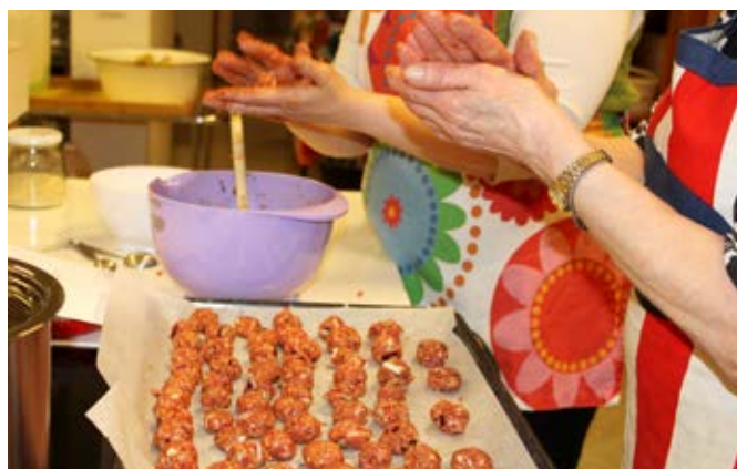
„Það er alltaf gaman að eiga góðar stundir með öðrum, kynnast nýju fólki og læra eitthvað nýtt,“ sagði þátttakandi á matreiðsluhluta námskeiðsins í vor.