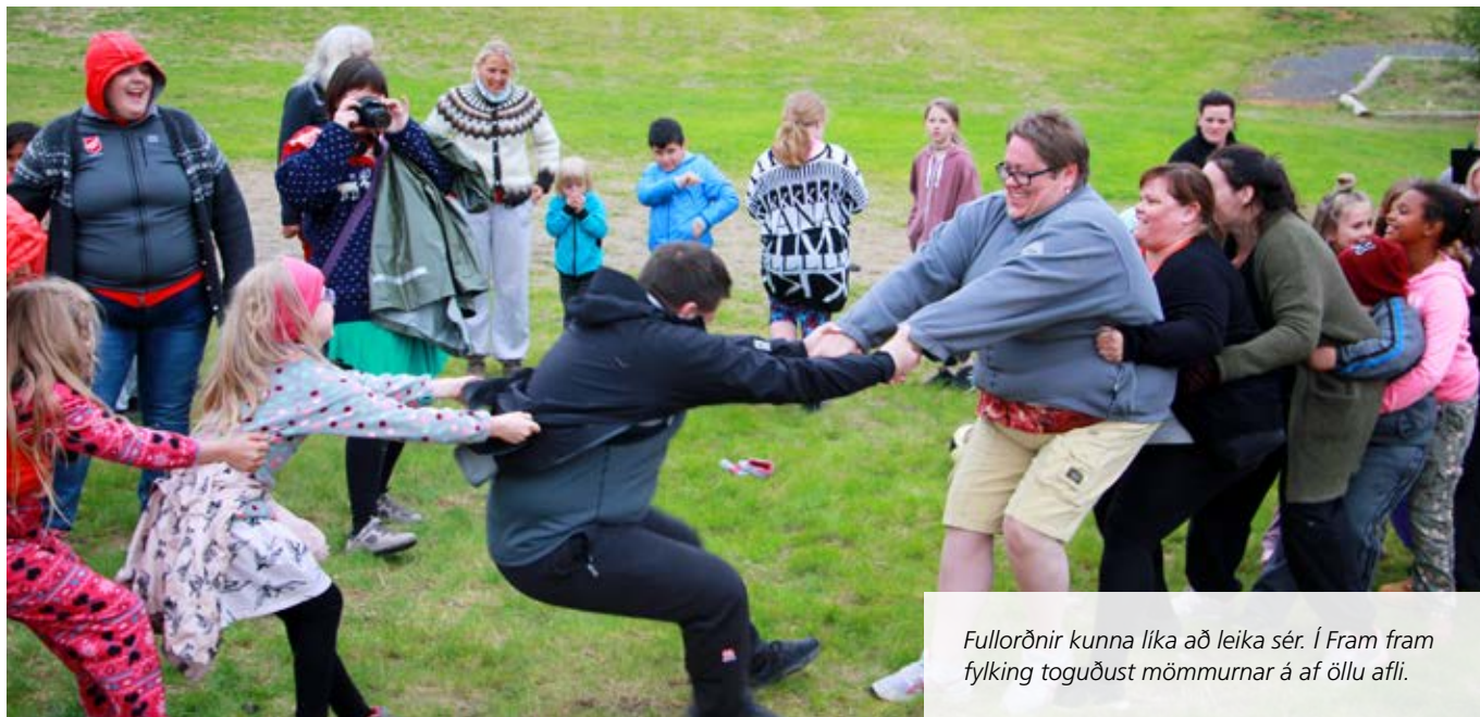
Fullorðnir kunna líka að leika sér. Í Fram fram fylking toguðust mömmurnar á af öllu afli.