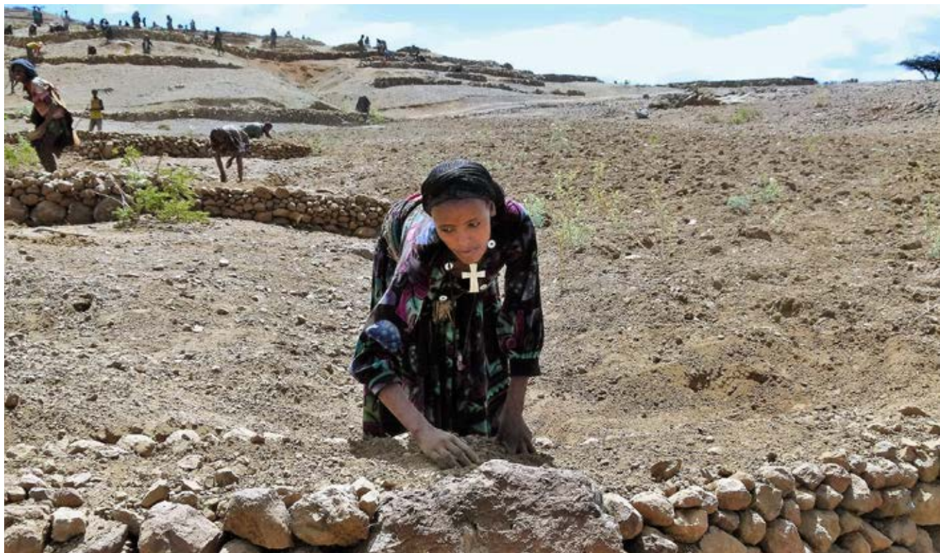
Í Lalibela í norðurhluta Eþíópíu hafa viðvarandi þurrkar valdið sjálfsþurftarbændum þungum búsisfjum. Neyðaraðstoð þar er sannkölluð hjálp til sjálfshjálpar. Hún felst m.a. í því að bændur hlaða varnargarða og grafa áveituskurði fyrir næsta regntíma og fá laun fyrir. Launin notar fólkið til að kaupa mat og aðrar nauðsynjar.