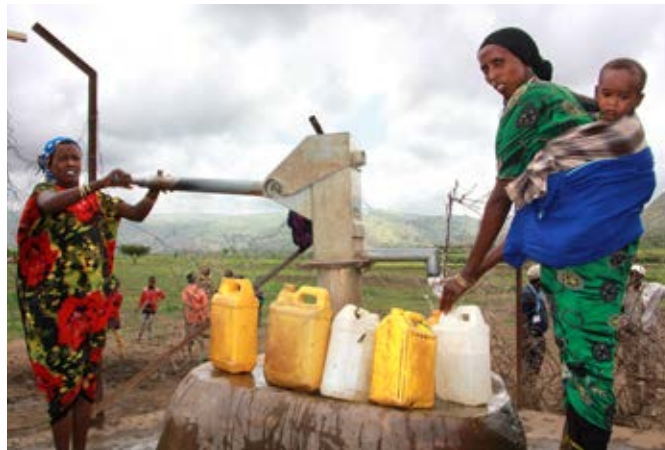
Heilsufar batnar þegar brunnur er byggður. Þegar brunnur er kominn við þorpið þurfa íbúarnir ekki lengur að deila vatnsbólum með búfénaði. Það kemur aftur í veg fyrir sjúkdóma af völdum óheilnæms drykkjarvatns. Fólk við góða heilsu hefur þrek til vinnu og sjálfshjálpar.

Í Godene nota um 720 fjölskyldur eða 4750 manns 3 brunna sem nýlega voru grafnir með aðstoð Hjálparstarfsins. Vegna þurrka fær fólk mataraðstoð frá stjórnvöldum en nú er loks farið að rigna. Fólk undirbýr jarðveginn og er að byrja að sá. Í Godene sáum við hvað allt breytist þegar rignir. Moldin var orðin brúnni og á ökrum hafði spröttið gras. Við sáum þó afleiðingar þurrka þar sem dýrahæ voru mörg á leið okkar um héraðið.