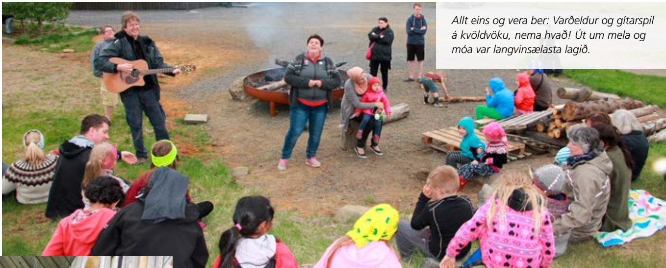
Allt eins og vera ber: Varðeldur og gítarspil á kvöldvöku, nema hvað! Út um mela og móa var langvinsælasta lagið.