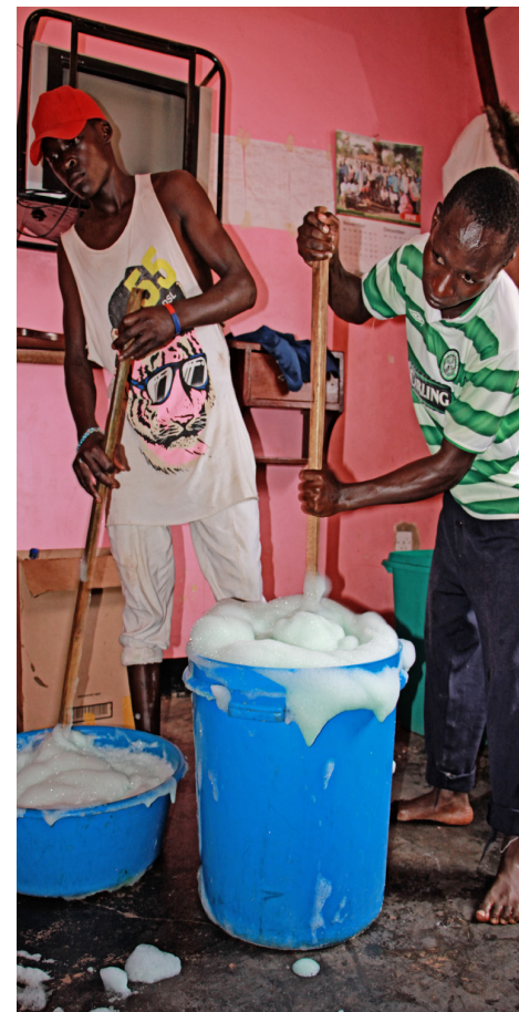
Í Rubaga gefst tækifæri til þess að læra sápugerð. Ungu fólkinu býst líka að læra um það hvernig hægt er að setja á fót sjálfstæðan atvinnurekstur meðal annars til að selja sápuframleiðsluna.

UYDEL samtökin hafa rúmlega tuttugu ára reynslu af því að vinna með ungu fólki í fátækrahverfum Kampala. Þau reka verkmenntamiðstöðvar þar sem unglingarnir geta valið sér ýmis svið til að öðlast nægilega hæfni til að verða gjaldgeng á vinnumarkaði eins og hárgreiðslu, matreiðslu, rafvirkjun og fleira. Samtökin leitast svo við að unga fólkið fái starfsnemastöður í fyrirtækjum sem oft leiði svo til atvinnutækifæra.