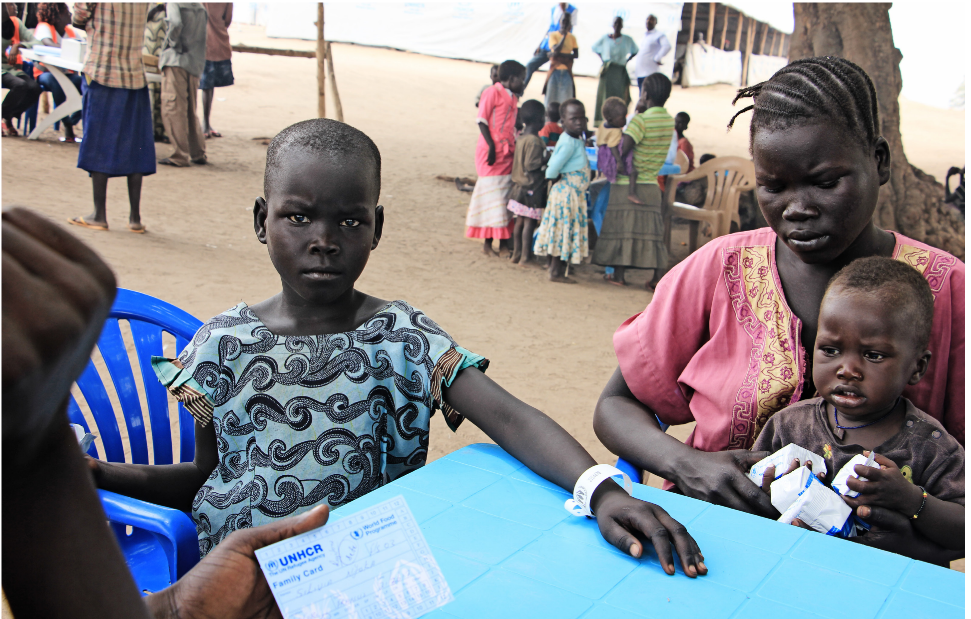
Drengurinn á myndinni kom yfir landamærin án fjölskyldu sinnar. Hann fær því hvítt armband sem segir til um stöðu hans og leit hefst að ættingjum hans. Konan sem er með honum á myndinni fylgdi honum yfir landamærin. Í fangi hennar situr eins árs sonur með orkubita eftir hættulegt ferðalag en stríðandi fylkingar ráðast í síauknum mæli á almennig í Suður-Súdan.