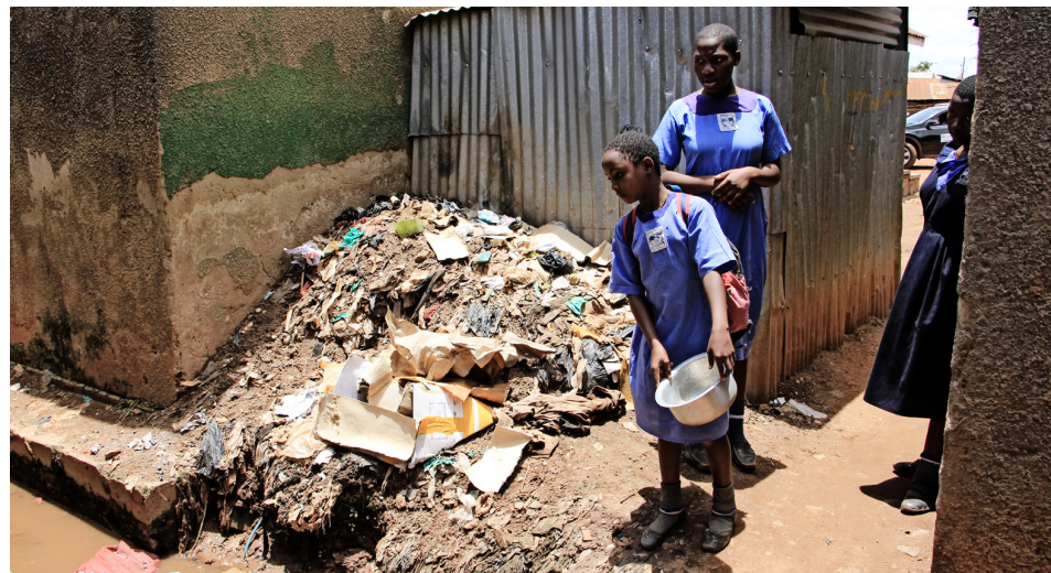
Skólástúlka skvettir skólþvatni í skurð fyrir utan heimili sitt eftir hádegismat en ruslinu er safnað í hrúgu við húsvegginn. Í fátækrahverfum Kampala er engin sorphirða og ekkert rennandi vatn inni í húsunum. Rafmagn er af skornum skammti.