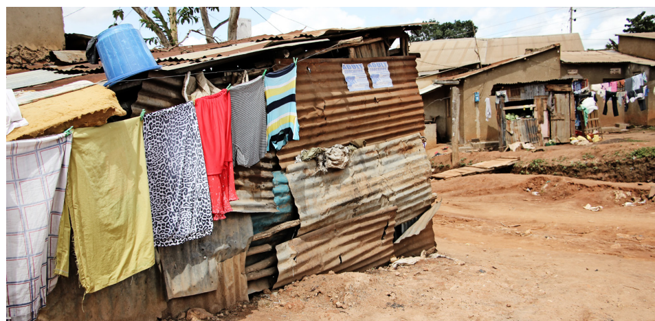
Húsakynni í fátækrahverfunum eru hriplek. Ryðguðu bárujárnir er klambrað saman ofan á og til viðbótar við hálfkörüð og hriplek múrsteinshús.