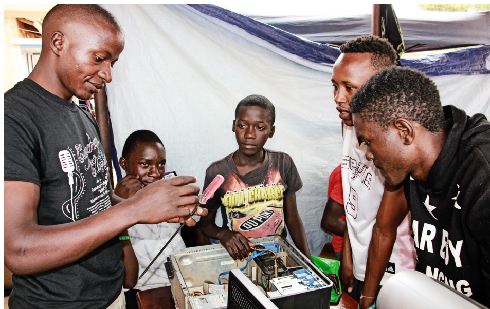
Tölvuviðgerðir og almenn rafvirkjun eru vinsælar námsgreinar meðal drengja í verkmenntamiðstöðinni í Rubagahverfi Kampala. Þegar fulltrúa Hjalparstarfsins bar að var þar aðeins ein stúlka við nám í iðngreininni.