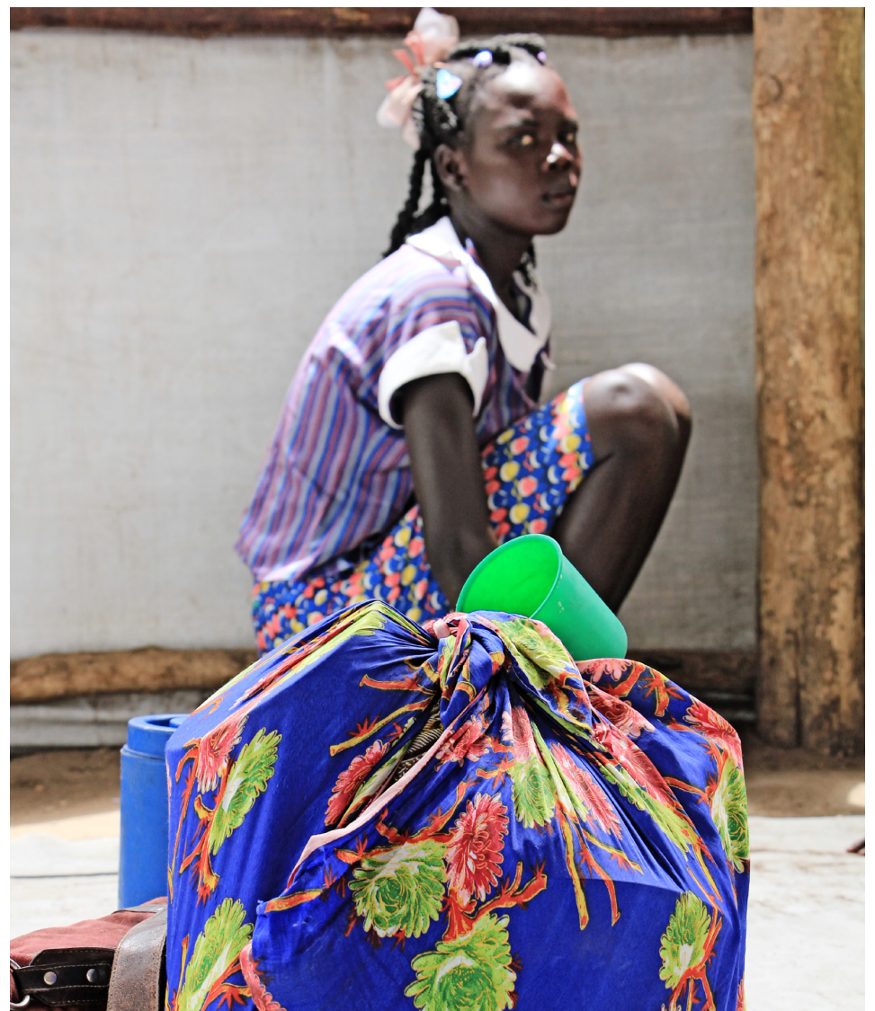
Ung stúlka situr hér með allt sitt hafurtask. Oft þurfa konur að flýja í ofboði. Mannréttinda-samtök á svæðinu hafa skýrt frá því að stríðandi fylkingar nauðgi og myrði óbreytta borgara í Suður-Súdan.