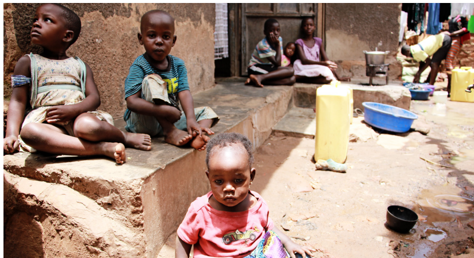
Um helmingur þjóðarinnar er yngri en 15 ára. Álagið á innviði samfélagsins er því mikið. Opinberir skólar eru yfirsetnir og aðgengi að heilsugæslu er takmarkað.

fyrir misnotkun af ýmsu tagi og eymdir leiðir til þess að þau verða auðveldlega fíkniefnum að bráð.