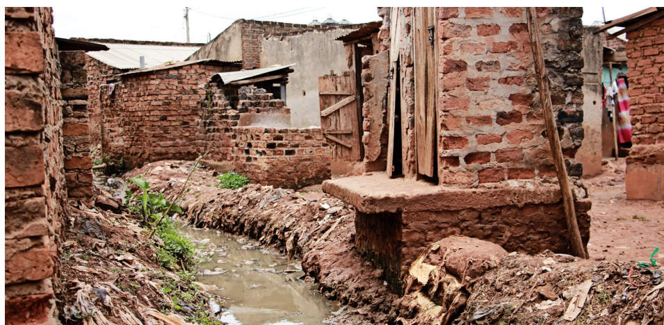
Þegar rignir flæðir skólþvatnið úr skurðunum inn í hrörleg húsakynnin en sameiginlegir kamrar eins og þessi standa þó hátt í hverfunum.