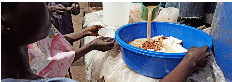
Flóttafólkið fær heita máltíð einu sinni á dag. Hér er skammtað baunasúpu með maísstöppu.

Flóttamannastofnun Sameinuðu þjóðanna hefur falið Lútherska heimssambandinu, LWF, að samhæfa mannúðaraðstoð hjálparstarfsamtaka og -stofnana í Moyohéraði í Norður-Úganda í nánú samstarfi við stjórnvöld á svæðinu. Meginmarkmið með aðstoðinni er að veita flóttafólkinu öryggi, skjól, aðgengi að hreinu vatni og hreinlæti, matarföng og stuðning til að hefja nýtt líf í friði og sátt við íbúana sem fyrir eru á svæðinu. LWF hefur fengið lof fyrir að bregðast bæði við neyð nýkomins flóttafólks til Úganda sem og þörfum þeirra sem nú þegar hafa fundið sér bústað í landinu með viðeigandi aðgerðum sem taka tillit til sjálfbærni og eins að tengja aðstoðina við uppbyggingarstarf á svæðum þar sem flóttafólk sest að.