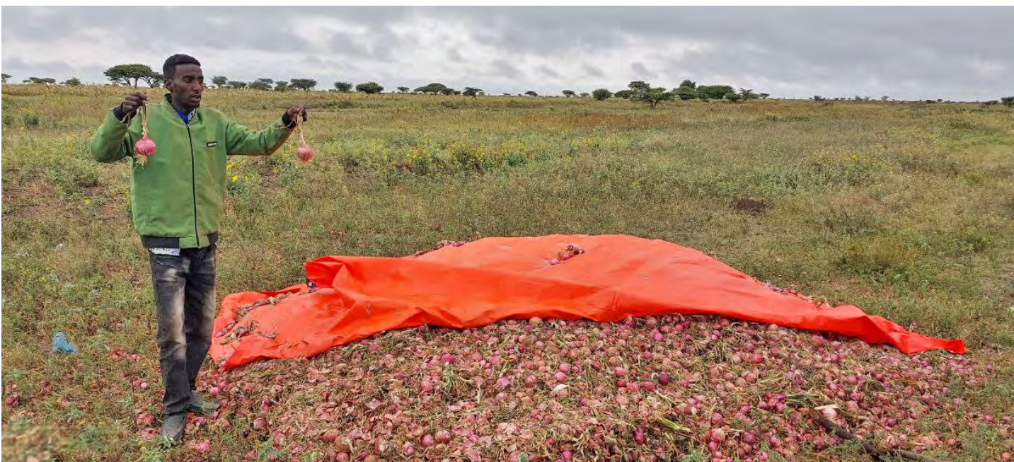
Elias fékk ríflega uppskeru af lauk sem gefur af sér töluverðar tekjur við sölu á markaði.