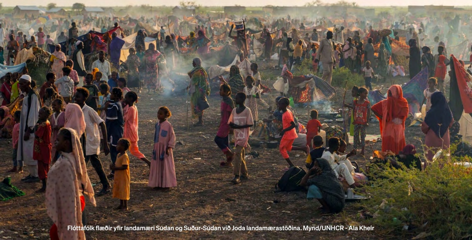
Flóttafólk flæðir yfir landamæri Súdan og Suður-Súdan við Joda landamærastöðina.